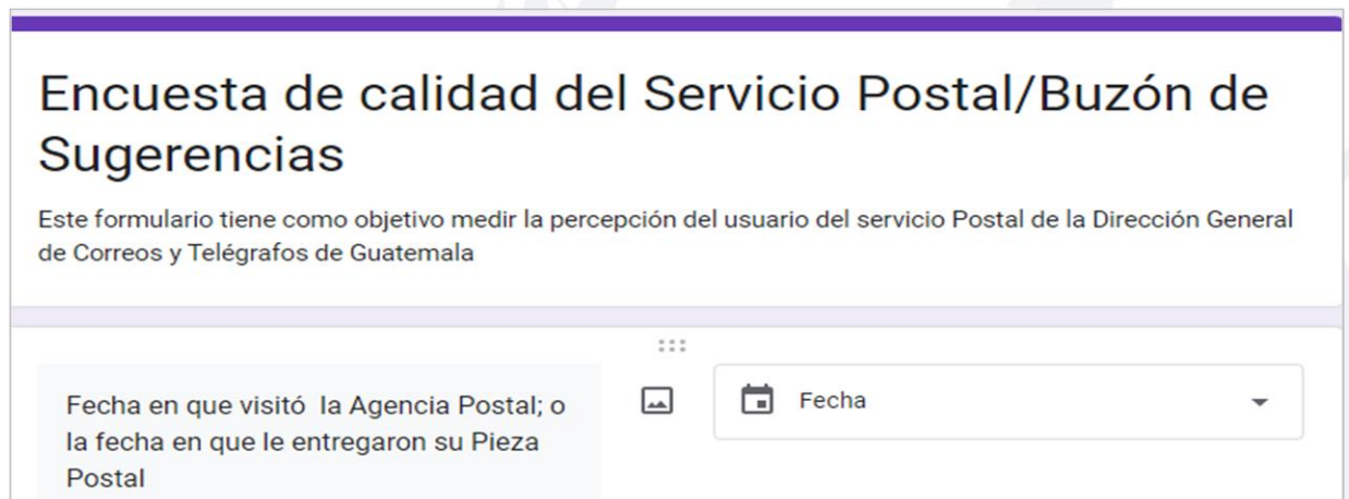
Imagen 1: Formato de la boleta digital

La Dirección General de Correos y Telégrafos presenta reportes estadísticos de la pertenencia étnica de los beneficiarios del servicio postal y desde el mes de septiembre del 2022 se implementó una encuesta digital, la cual tiene como objetivo medir la valoración del servicio postal que tiene el usuario, así mismo dicho instrumento recopila información de la pertenencia sociolingüística de los usuarios del servicio postal, recopilando información del sexo y edad de las personas, su pertenencia étnica y la comunidad lingüística a la que pertenecen, refiriéndose a los idiomas reconocidos por la Ley de Idiomas Nacionales. A continuación se presenta el segmento de la boleta donde se registra información de la pertenencia sociolingüística.